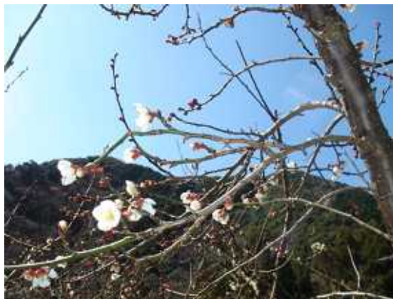
(今年)2008年2月14日撮影(平原部)

梅干は一時の在庫過多から脱却しましたが、消費量減と安値志向で依然高級品は余り傾向です。不安定な梅干事情を解消するため、数年前から青梅としての出荷の割合が増えており、今年も冰糖販売には追い風になることが期待されます。