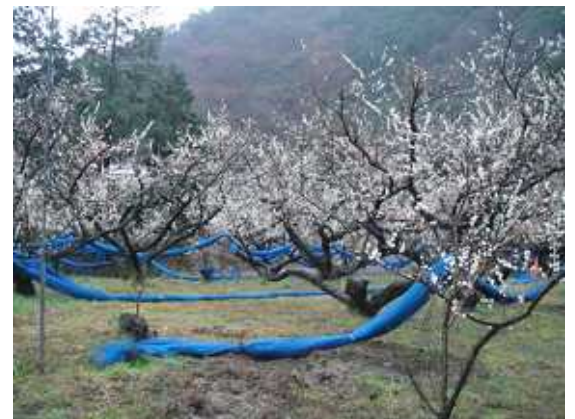
(昨年)2007年2月14日撮影(南部川村)